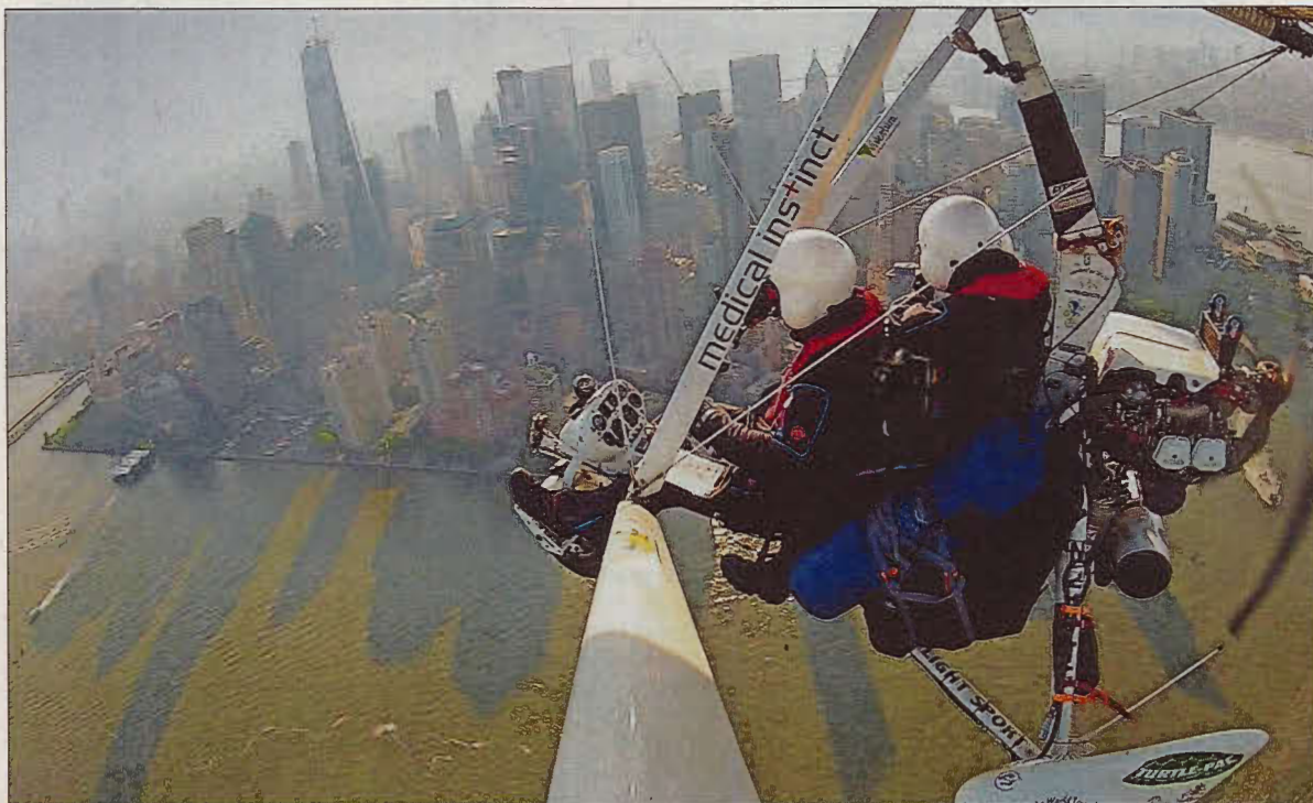
Über New York: ein Höhepunkt für die beiden Weltreisenden.